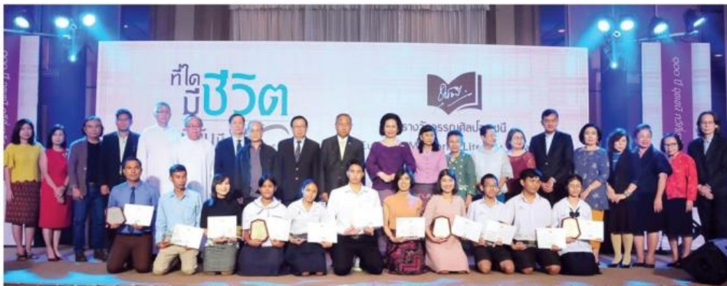
ประธานในพิธี ประธานจัดงาน คณะกรรมการตัดสิน และคณะกรรมการรางวัลวรรณศิลป์อุษเชนี คณะกรรมการตัดสิน พร้อมด้วยคณะกรรมการคัดกรอง ร่วมถ่ายภาพ

แห่งประเทศไทยร่วมกันจัดการประกวดวรรณกรรม "วรรณศิลป์อุษเชนี" เพื่อสืบสานและพัฒนาการใช้ภาษาไทย รวมถึงส่งเสริมเยาวชนให้สนใจในงานวรรณศิลป์ โดยได้รับพระมหากรุณาธิคุณจากสมเด็จพระกนิษฐาธิราชเจ้า กรมสมเด็จพระเทพรัตนราชสุดาฯ สยามบรมราชกุมารี พระราชทานโล่รางวัลชนะเลิศในทุกประเภท