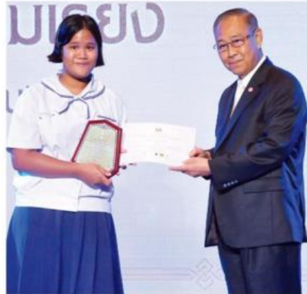
ด.ญ.ลัม ชนะเลิศ ความเรียง ระดับนักเรียน ผลงาน "ดอกหญ้าพลัดถิ่น"