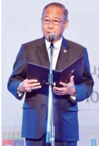
พล.อ.อ.ชลิต พุกผาสุข องคมนตรี ประธานในพิธีกล่าวเปิดงาน