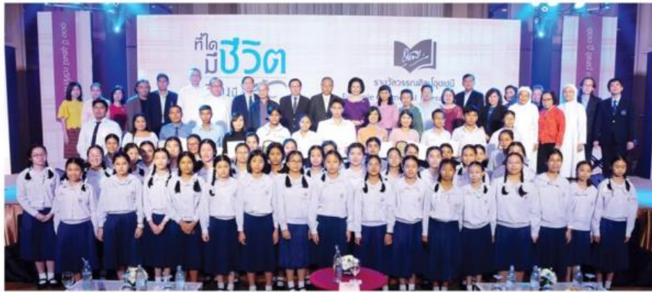
พร้อมหน้านักขับร้องโรงเรียนอัสสัมชัญคอนแวนต์ ร่วมกับวง East wind Chorus oydL7dKk, sk;bmpk] ypvulgmbiNogvg=up