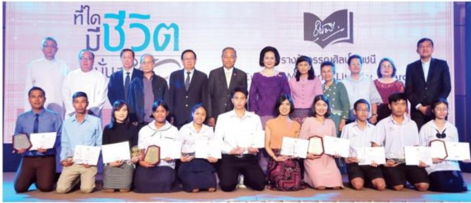
ประธานในพิธี ประธานจัดงาน คณะกรรมการตัดสิน และคณะกรรมการรางวัลวรรณศิลป์ถ่ายภาพเป็นที่ระลึกกับผู้รับรางวัลชนะเลิศ รางวัลชมเชย กลอนสุภาพ ระดับนักเรียน ระดับประชาชน, ความเรียง ระดับนักเรียน ระดับประชาชน