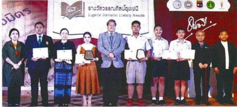
คุณนก.ร่วมถ่ายภาพกับผู้ได้รับรางวัล ประเภทกลอนสุภาพ