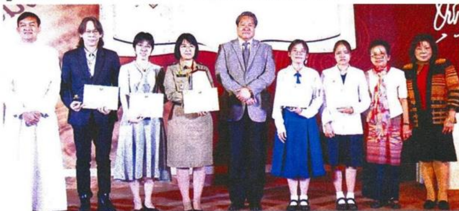
คณะกร.ร่วมถ่ายภาพกับผู้ได้รับรางวัล ประเภทความเรียง